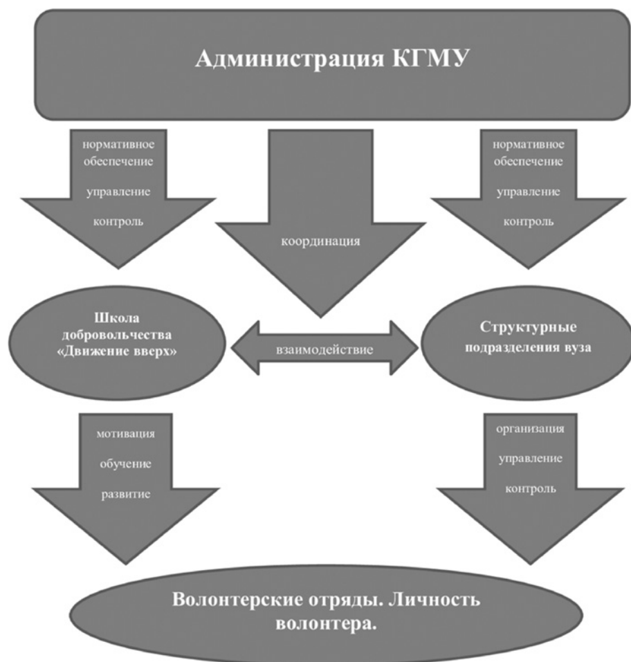
Рис. 2. Организационно-мотивационная модель системы подготовки и развития волонтеров, реализуемая в условиях медицинского вуза на примере КГМУ.

мы получаем волонтерский/добровольческий отряд как структурированный механизм, объединяющий студентов, изъявивших желание бескорыстно выполнять работу по профессионально ориентированной деятельности. С другой стороны, после прохождения подготовки в школе добровольчества «Движение вверх», мы получаем мотивированную, компетентную личность студента, альтруистически настроенную, стремящуюся к профессиональному самосовершенствованию.