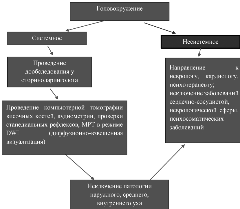
Рис. 3. Алгоритм диагностики при головокружении.

ния, поскольку в зависимости от диагноза терапия будет значительно различаться.