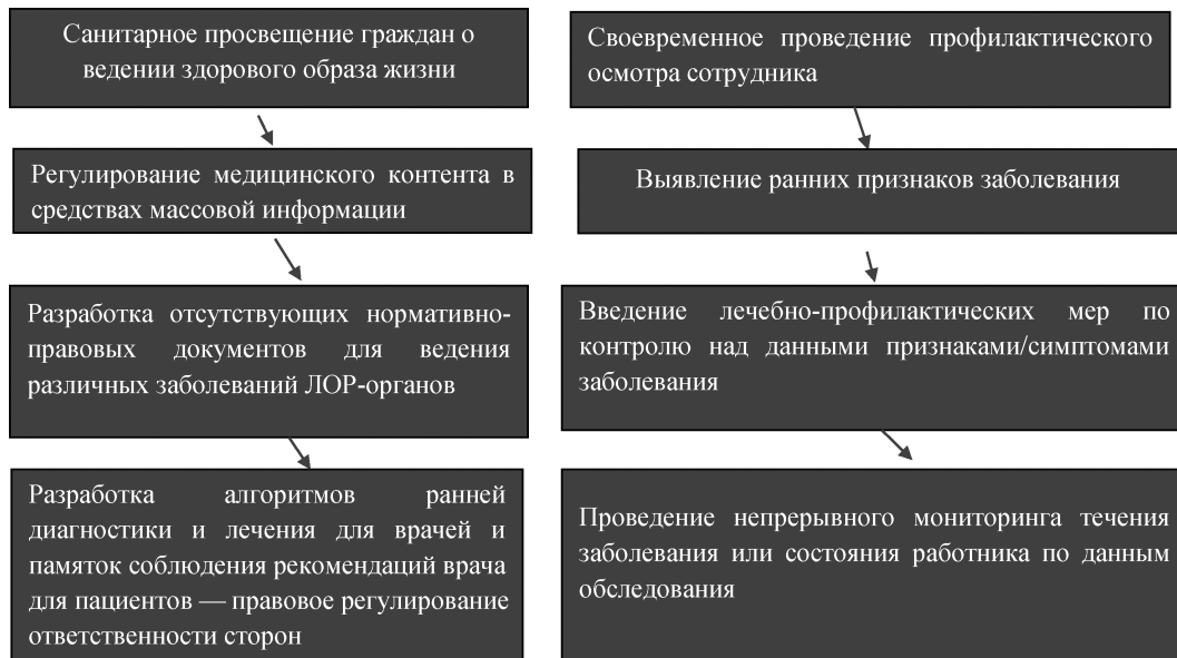
Рис. 6. Алгоритм профилактики опухолевых заболеваний и непрерывного мониторинга состояния здоровья пациента.

низации медицинской помощи при разработке специальных алгоритмов, повышение качества жизни пациента, снижение экономического бремени от несвоевременной диагностики и использования дорогих технологий лечения.