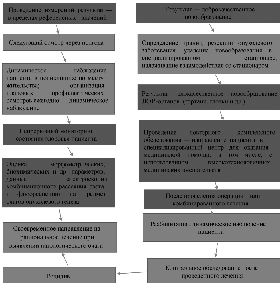
Рис. 5. Алгоритм ранней диагностики опухолевых заболеваний.

Использование комбинированных оптических технологий, таких как комбинационное рассеяние света и флюоресценция, позволяет дифференцировать ткани ЛОР-органов, пораженные опухолевым и воспалительным процессом, от интактной ткани, обеспечивая раннюю неинвазивную диагностику данной патологии, своевременную маршрутизацию пациента для проведения лечения, повышение качества орга-