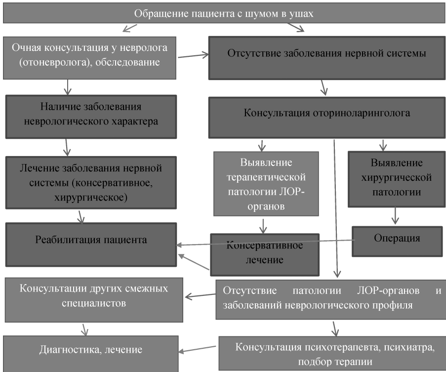
Рис. 1. Алгоритм ведения пациента с шумом в ушах.

дим междисциплинарный подход к ведению пациентов с данным симптомом и в зависимости от причины, вызвавшей его, подбор соответствующего плана лечения.