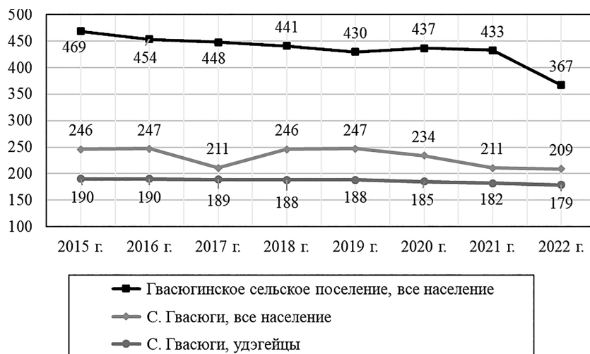
Рис. 1. Численность населения Гвасюгинского сельского поселения района имени Лазо Хабаровского края за 2015—2022 гг. (в абс. ед.).

Оказание квалифицированной медицинской помощи коренным малочисленным жителям села осуществляет ФАП с. Гвасюги Филиала № 2 КГБУЗ «Районная больница» района имени Лазо, а также на основании плановых выездов бригады специалистов районной больницы № 2 из поселка Мухен. Помещение, в котором расположен ФАП с. Гвасюги, требует ремонта. Оказывается неотложная доврачебная помощь при острых заболеваниях, травмах, отравлениях и других неотложных состояниях; проводятся санитарно-гигиенические, противоэпидемические мероприятия, вакцинопрофилактика; оказывается паллиативная помощь больным, в том числе с онкологическими заболеваниями (в соответствии с рекомендациями врачей-специалистов); осуществляется транспортировка до места госпитализации больных, нуждающихся в стационарной медицинской помощи, в том числе женщин с патологией беременности. Следует указать, что из-за труднодоступности (гравийная дорога) и отдаленности с. Гвасюги от КГБУЗ «Районная больница» района имени Лазо в пос. Переяславка (92 км) и основных учреждений здравоохранения г. Хабаровска (200 км), получение высококвалифицированной медицинской помощи (например, в случае травмы), а также полноценного обследования в случае заболевания взрослого человека или ребенка